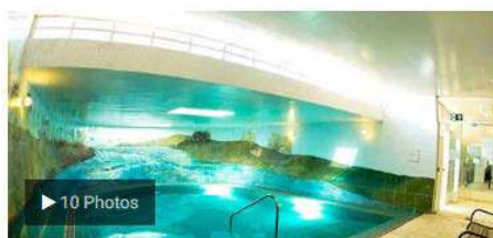
Araxá (MG) - Hotel Nacional Inn Previdência