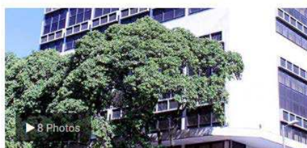
Belo Horizonte (MG) - Hotel Nacional Inn