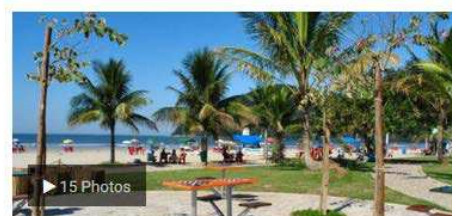
Bertioga (SP) | 27 Praia Hotel