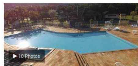
Atibaia (SP) | Propagandistas (day use)